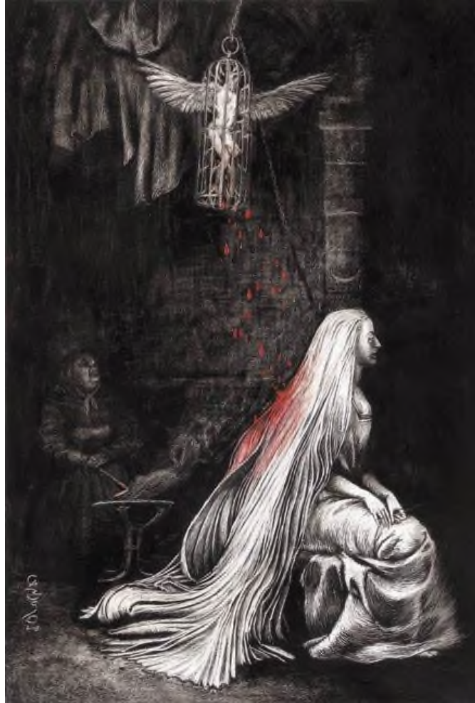
Ilustración de Santiago Caruso en la edición de Libros del Zorro Rojo

Pude preguntarle a Santiago Caruso por qué había transformado a la muchacha en un pájaro. Su respuesta fue la siguiente: