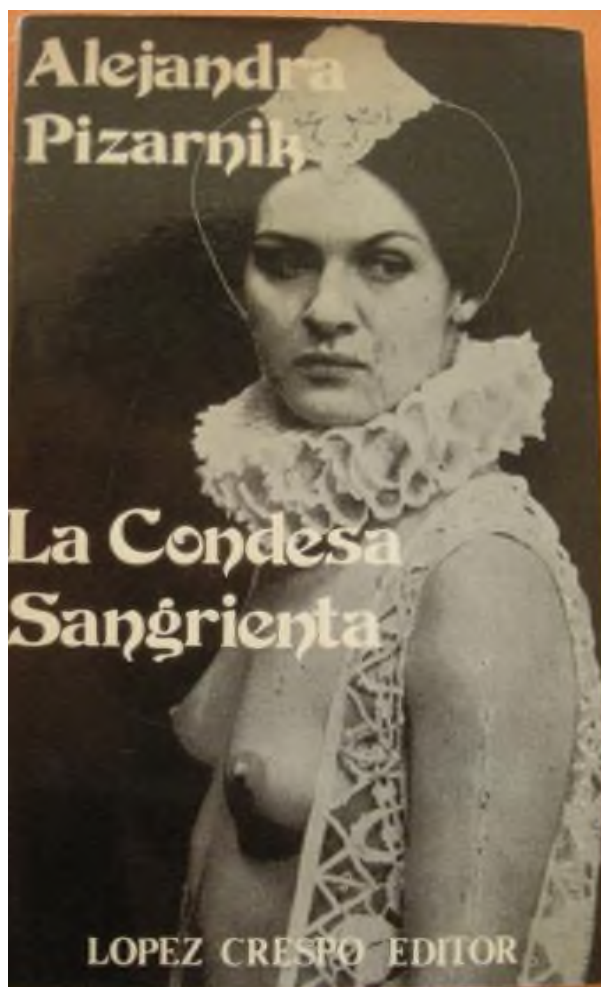
Edición de 1976 (Bibliothèque Vercors, Le Mans). Fotografía de Paloma Picasso tomada de la película de W. Borowczyk, "Cuentos inmorales"

La condesa sangrienta nace como reseña literaria del libro de Valentine Penrose titulado Erzsébet Bátor . La comtesse sanglante (1957, luego 1962) 7 , primero en la revista mexicana Diálogos en 1965 bajo el título «La libertad absoluta y el horror» 8 , luego en Buenos Aires en la revista Testigo 9 . En el año 1971 aparece como libro en la editorial Aquarius de Buenos Aires como La condesa sangrienta ; la primera reedición es de 1976 10 .